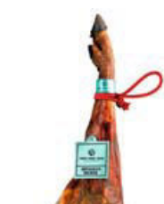
SÁNCHEZ ROMERO CARVAJAL

F. BABILLA. Es la zona más estrecha (al estar delimitada por los huesos fémur y coxal) y magra del jamón, y por tanto, de carne menos jugosa. Si prevee que va a consumir la pieza lentamente, puede comenzar a cortar por aquí para que no se pierdan el sabor y los aromas de la maza, la parte más noble.