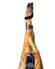
CASA DE SALINAS