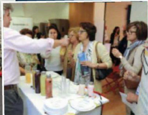
Los invitados, además de asistir a todo tipo de talleres, podían degustar lo que se elaboraba.