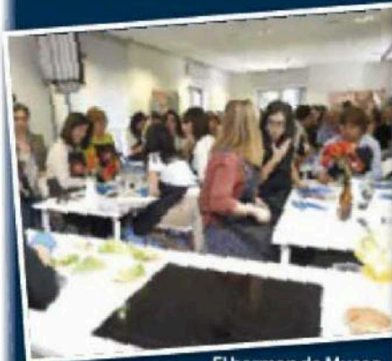
El barman de Museo Chicote nos preparó el cóctel de SEMANA.

También se sortearon 5 suscripciones anuales de la revista y de 20 lotes de utensilios de cocina. Los ganadores pueden consultarse en www.semana.es